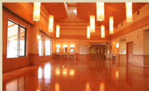
1階デイサービスホール