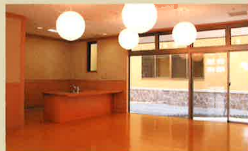
1階ユニット生活室