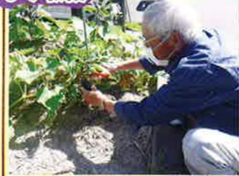
立派ななすを収穫しました