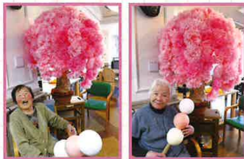
満開の桜とともに…。 実はこの木には秘密が…!