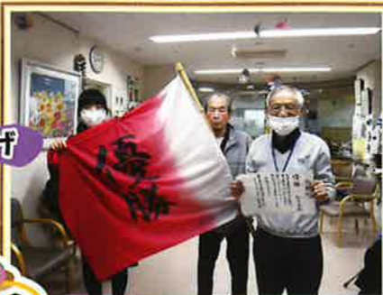
わなげ大会で優勝されました! 旗も賞状も利用者様手作りです☆