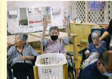
赤・白チームに分かれ、玉入れは激戦になりました