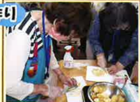
料理は得意!私に任せて!