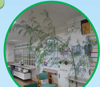
山から取ってきた笹から…