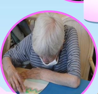
作品づくり “かき水”💧