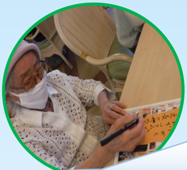
どんなお願い事をしましたか？