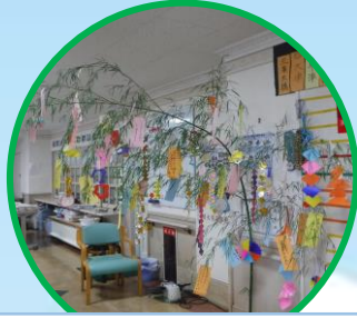
色とりどりの短冊が飾られました☆