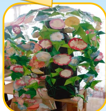
飾り付けをしました♪