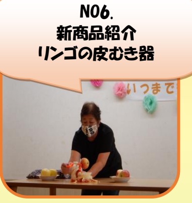
N06. 新商品紹介 リンゴの皮むき器