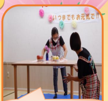
N01. テーブルクロス引き