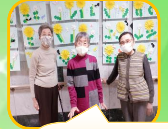
タンポポの 作品の前で記念撮影