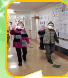
歩行訓練に 行ってきまーす♪

屈伸運動や壁はい運動、歩行訓練等々… 利用者様の身体状況を確認しながら看護師が行っています。