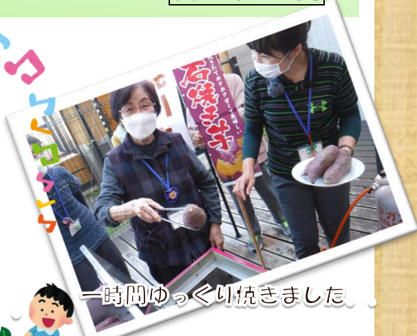
一時間ゆっくりに焼きました。