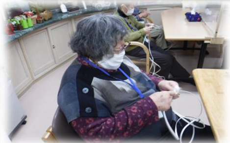
クラフトバンドでうろこ編みを初体験しました。