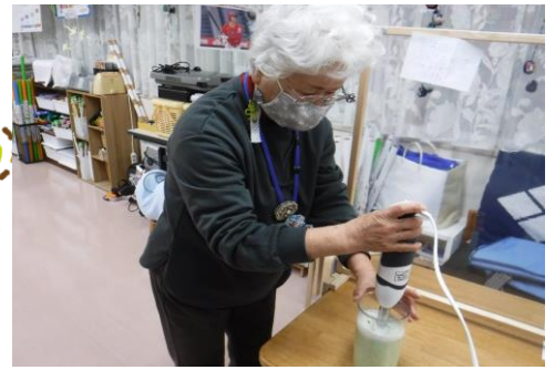
柔らかくて美味しいお野菜。ありがとうございました。