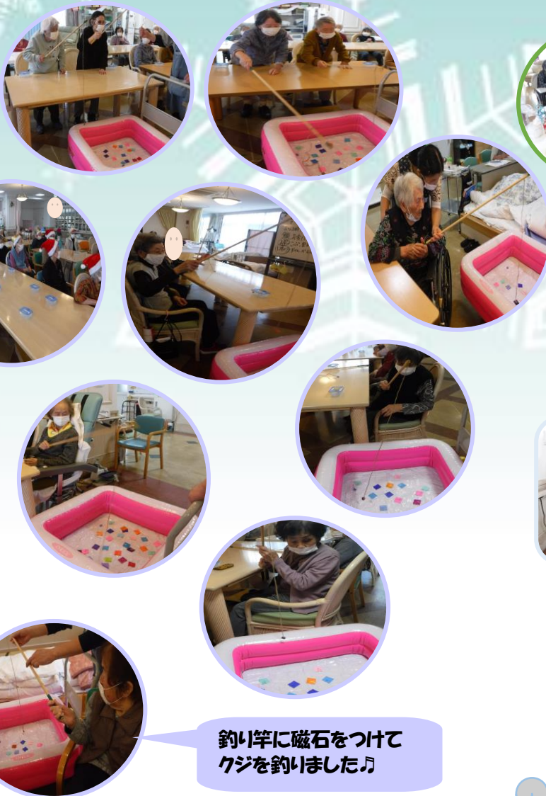
釣り竿に磁石をつけて クジを釣りました♪